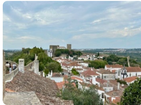
Vila de Óbidos and Lagoa de Óbido