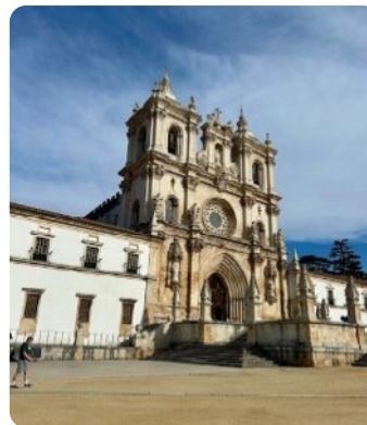
The Alcobaça Monastery