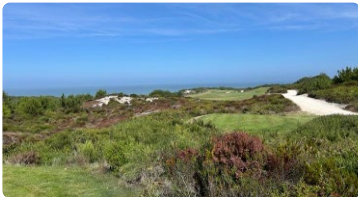
West Cliffs Golf Course