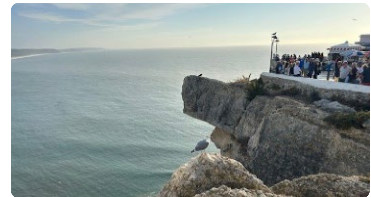
Vila de Nazaré