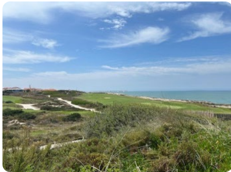
Praia D'El Rey Golf Course

Als er prijzen waren geweest voor het gezelligste, sociaalste team, dan waren we (samen met de Ieren) zeker in de prijzen gevallen! Wat hebben we genoten!